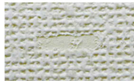
表面が破けて裏打ち紙が見える (1～2級相当)