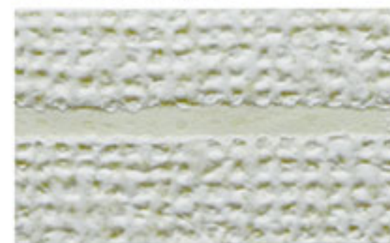
裏打ち紙まで達するキズが発生 (1～2級相当)