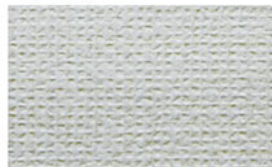
若干キズがつく程度 (4～5級相当)