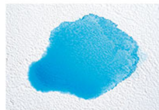
水汚れが全体に広がる